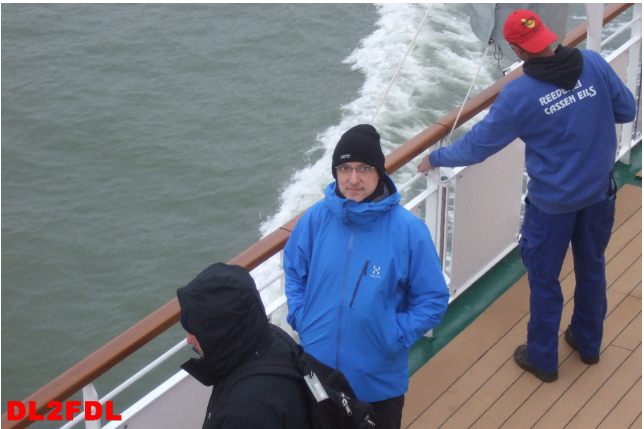
Ein letzter Blick, bevor die Insel im Nebel verschwindet.