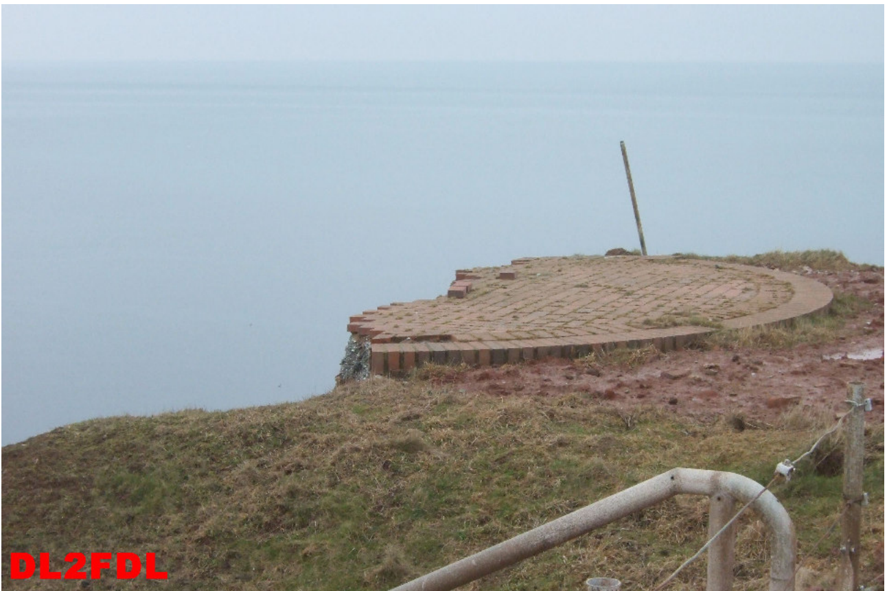
Erster Rundgang über die Insel