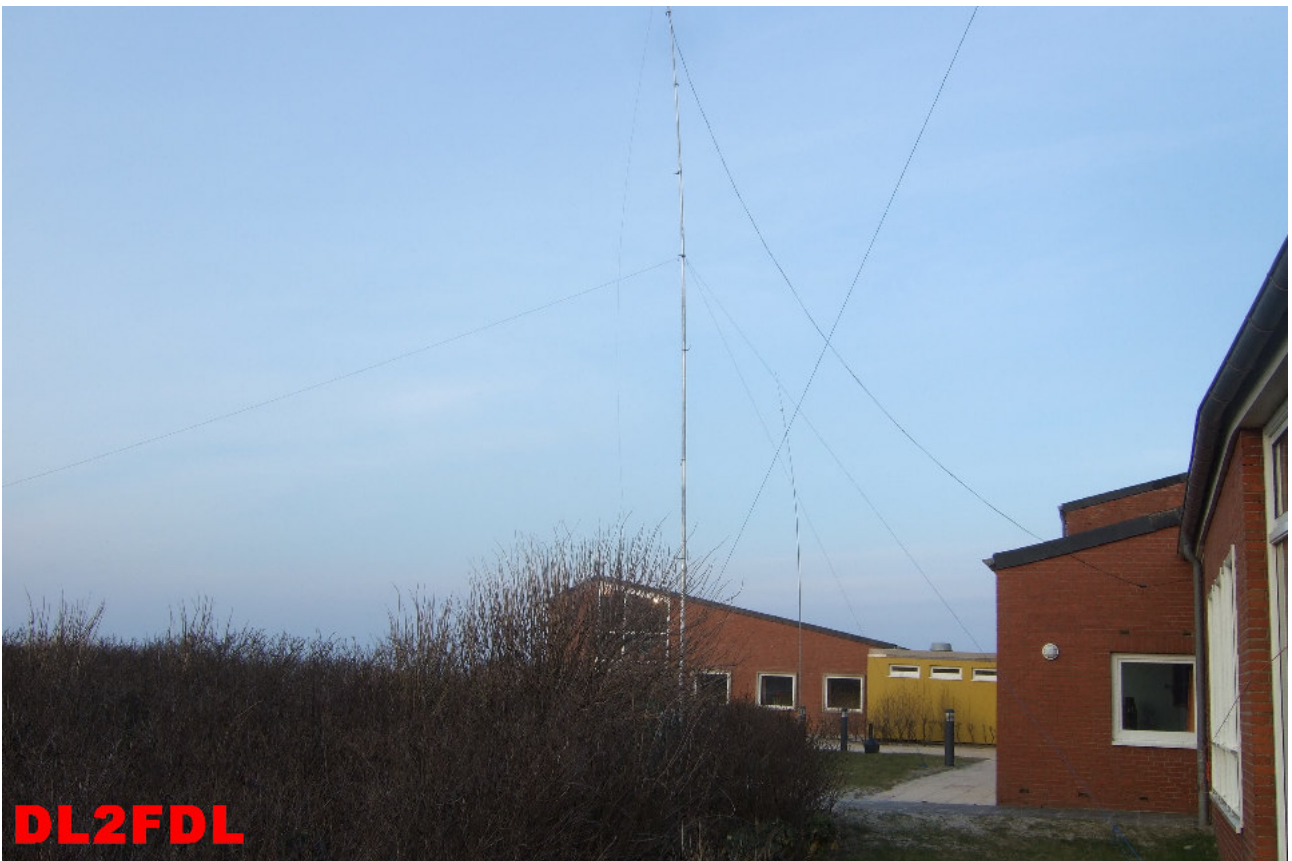
Spiderbeam im Sonnenuntergangslicht.