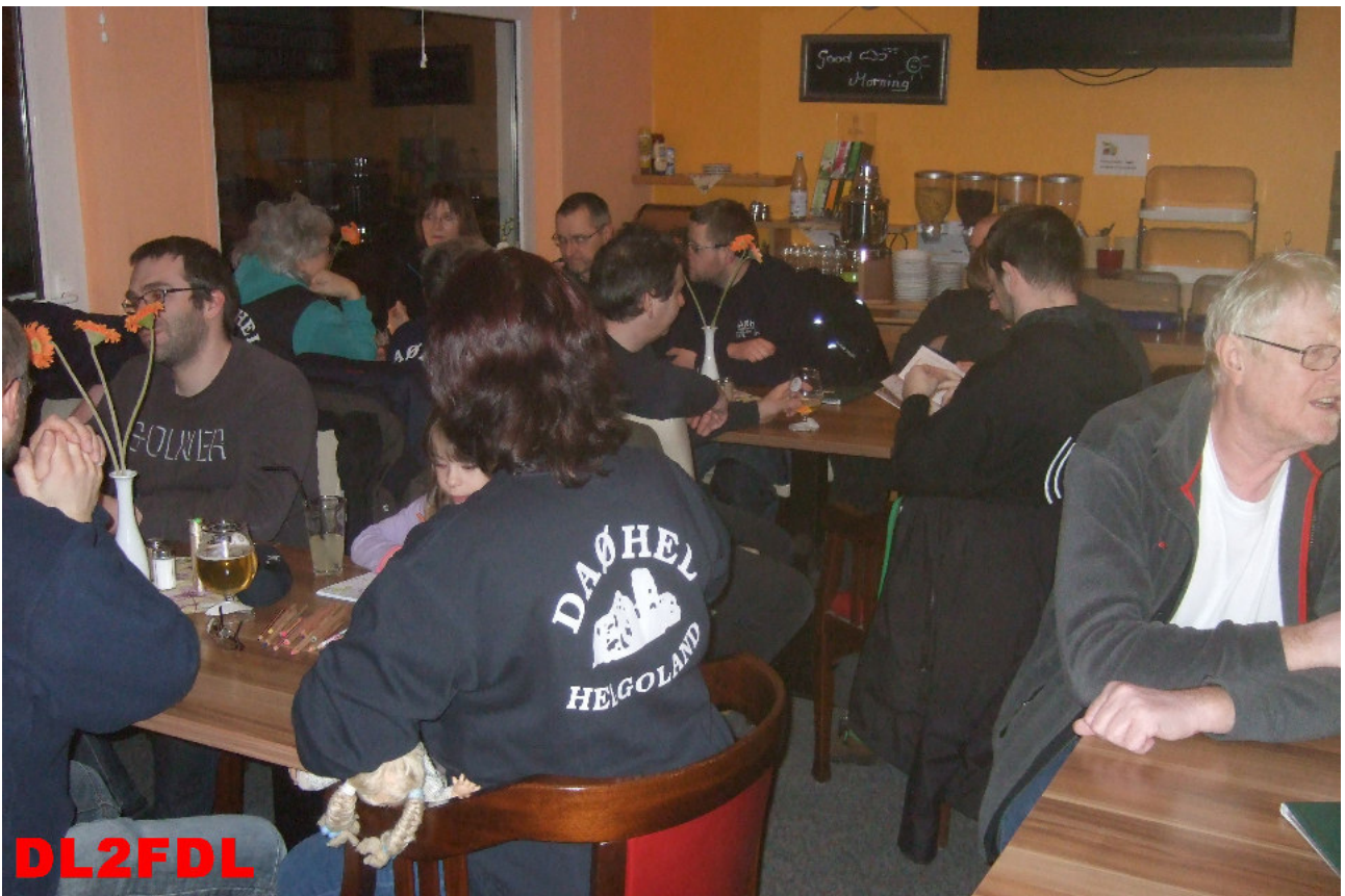
Ein gemeinsamer Abend bei einem Helgoländer Eiergrog oder Bier