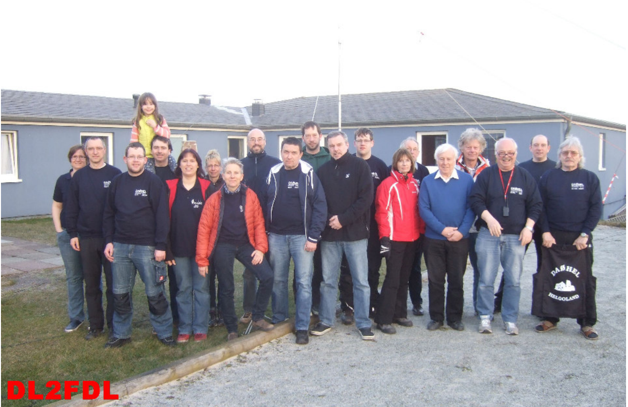
Dicht gedrängt .....