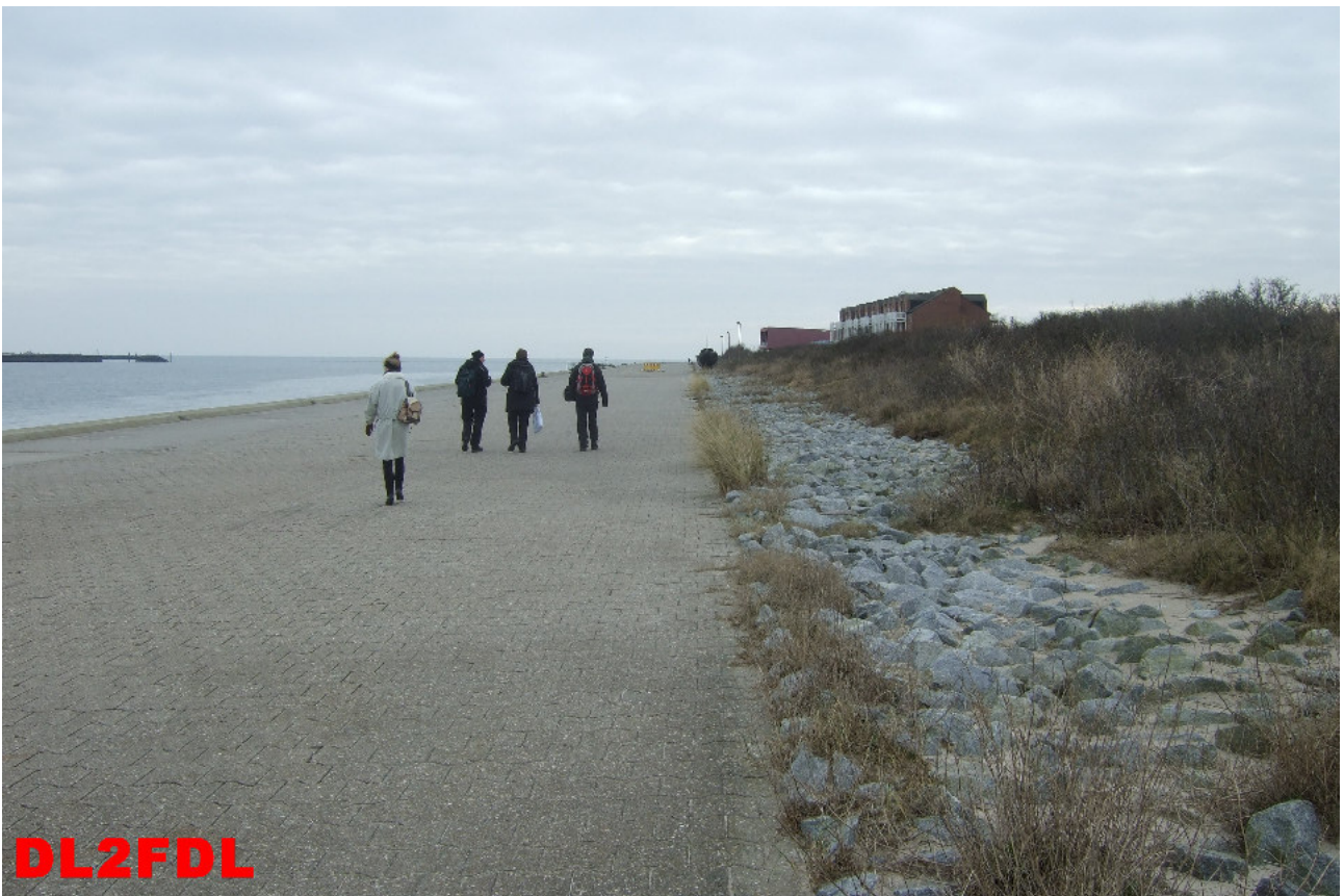
Leider ist die Zeit um, der Abreisetag.