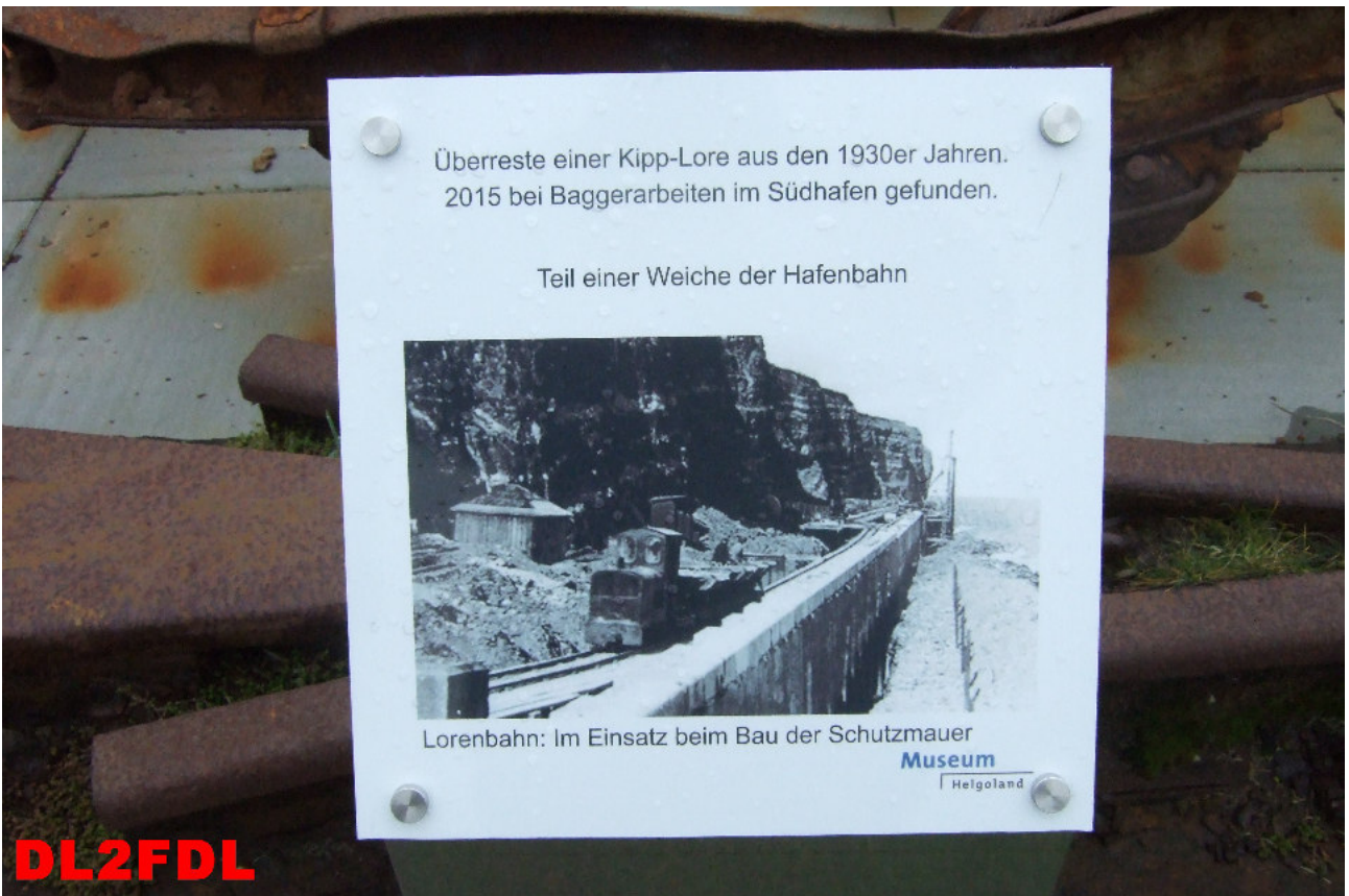
Altlasten des 2. Weltkrieges, Ehemalige Schienenstrecke zum Materialtransport für den Bau der Schutzmauer um die Insel.

Überreste einer Kipp-Lore aus den 1930er Jahren. 2015 bei Baggerarbeiten im Südhafen gefunden.