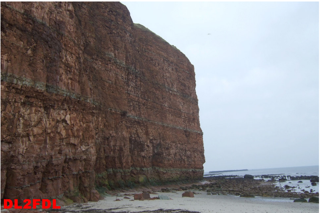
Der Sandsteinfels bei Ebbe.