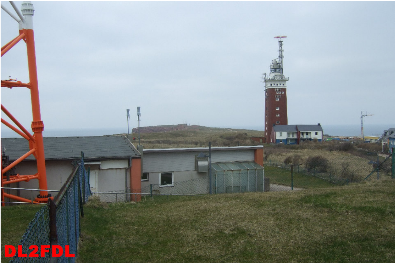
Der Helgoländer Leuchtturm