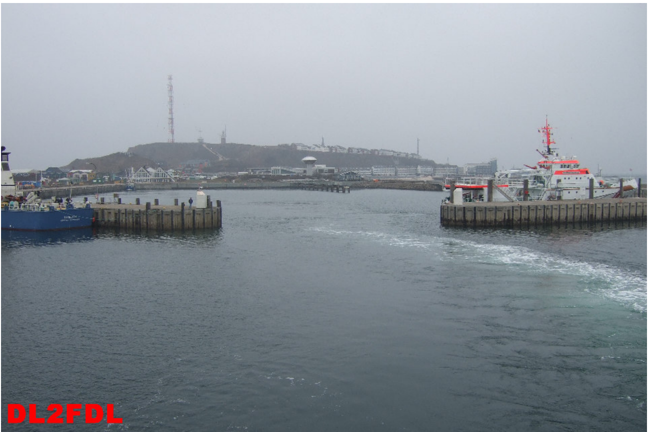
Verlassen des Hafens