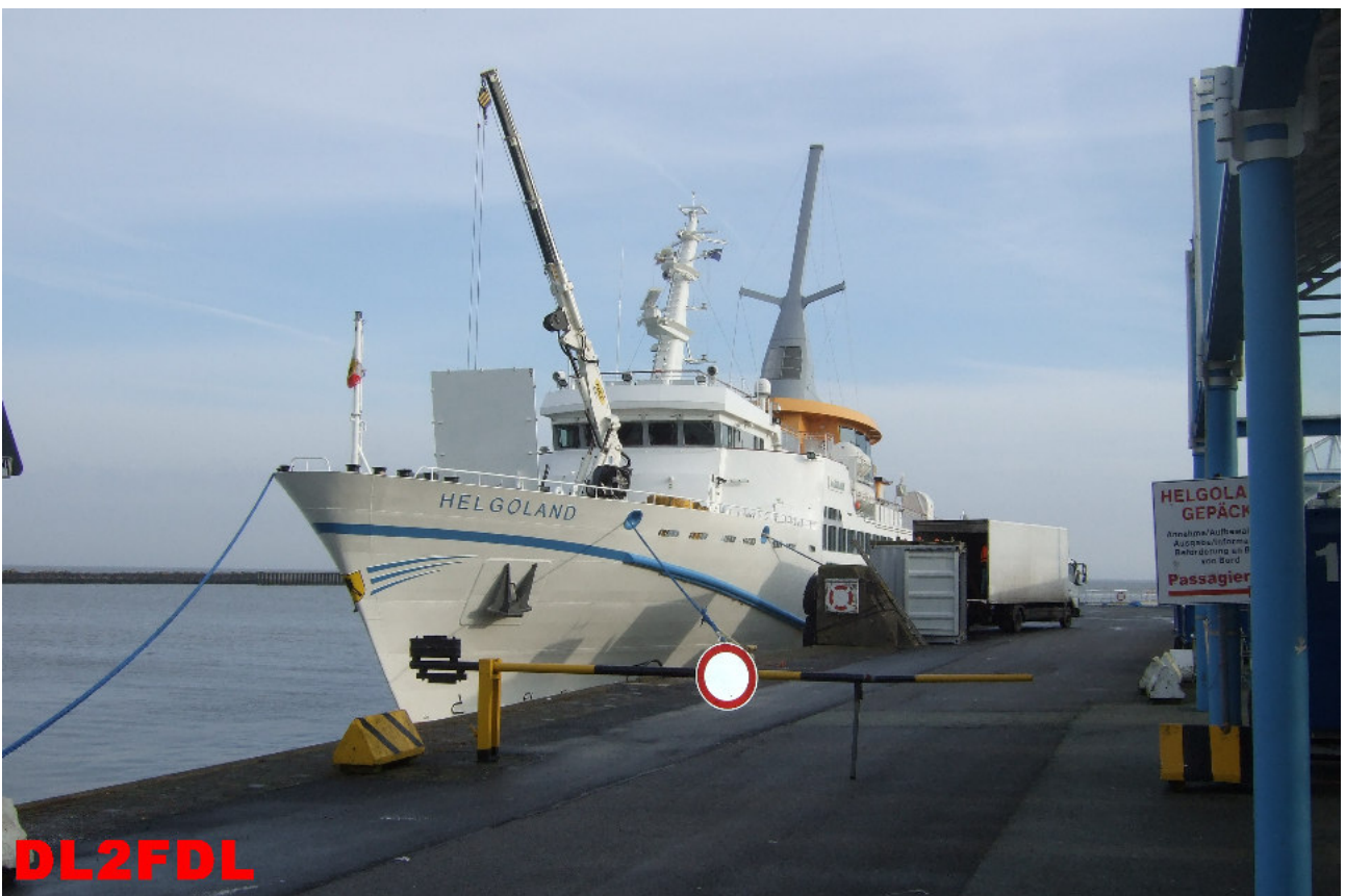
Übersicht über einen Teil der Insel Helgoland