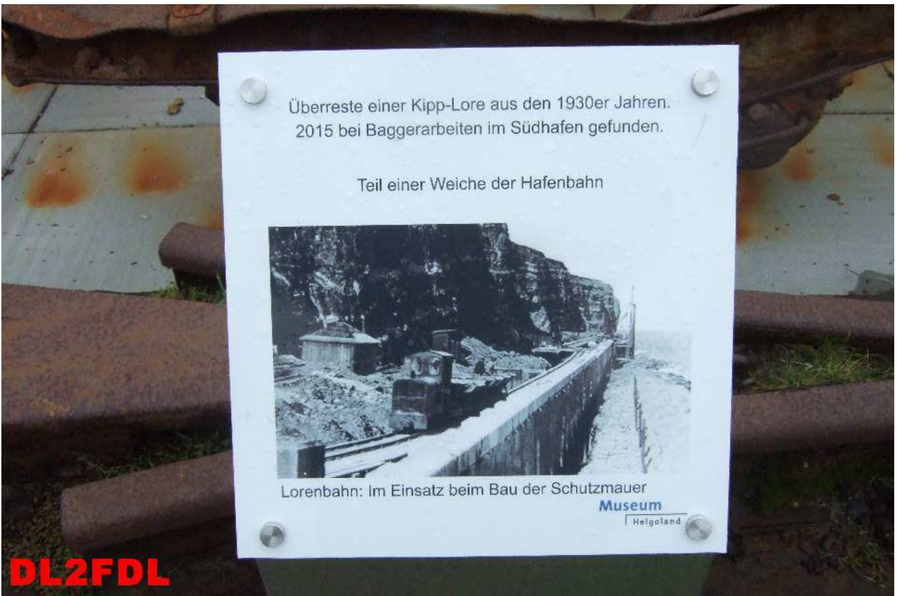
Altlasten des 2. Weltkrieges, Ehemalige Schienenstrecke zum Materialtransport für den Bau der Schutzmauer um die Insel.

Überreste einer Kipp-Lore aus den 1930er Jahren. 2015 bei Baggararbeiten im Südhafen gefunden.