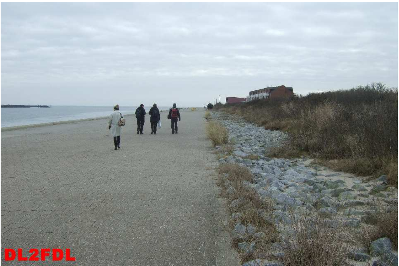
Leider ist die Zeit um, der Abreisetag.