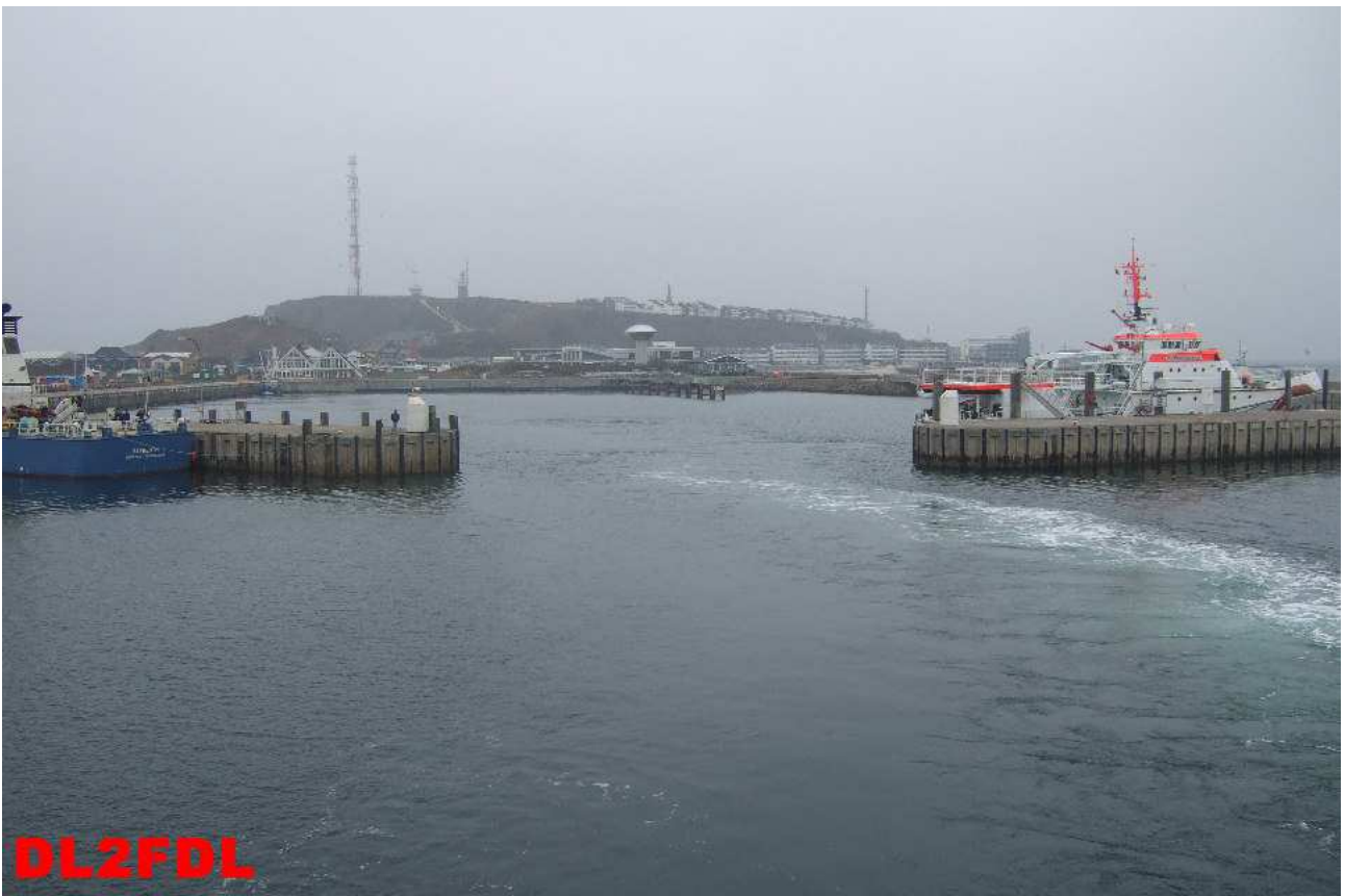
Verlassen des Hafens