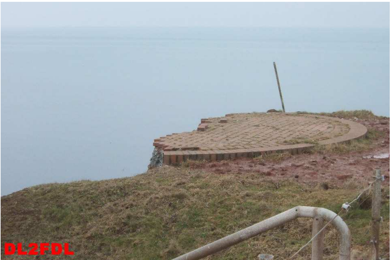
Erster Rundgang über die Insel