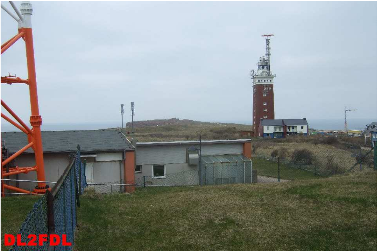
Der Helgoländer Leuchtturm