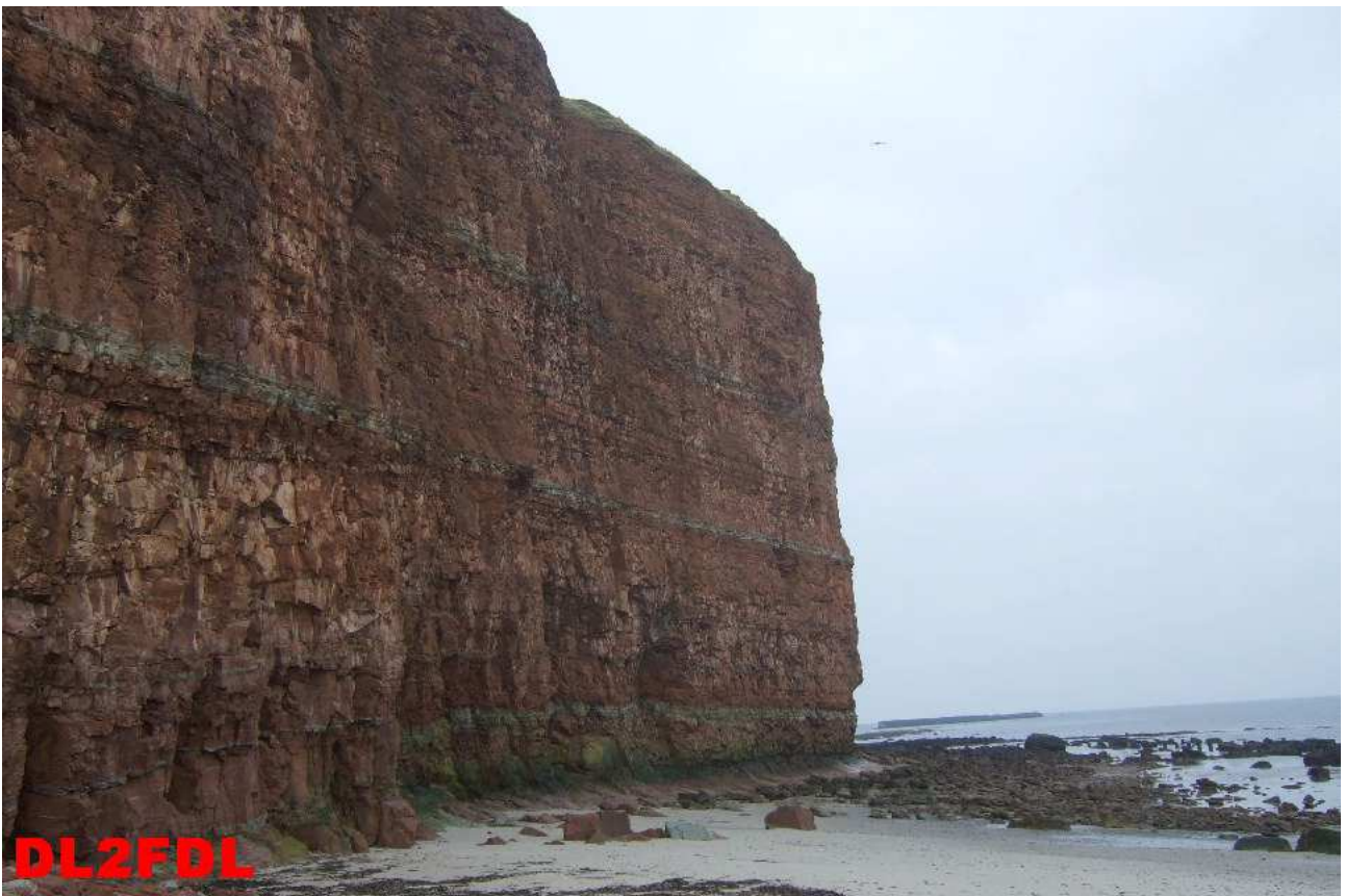
Der Sandsteinfels bei Ebbe.