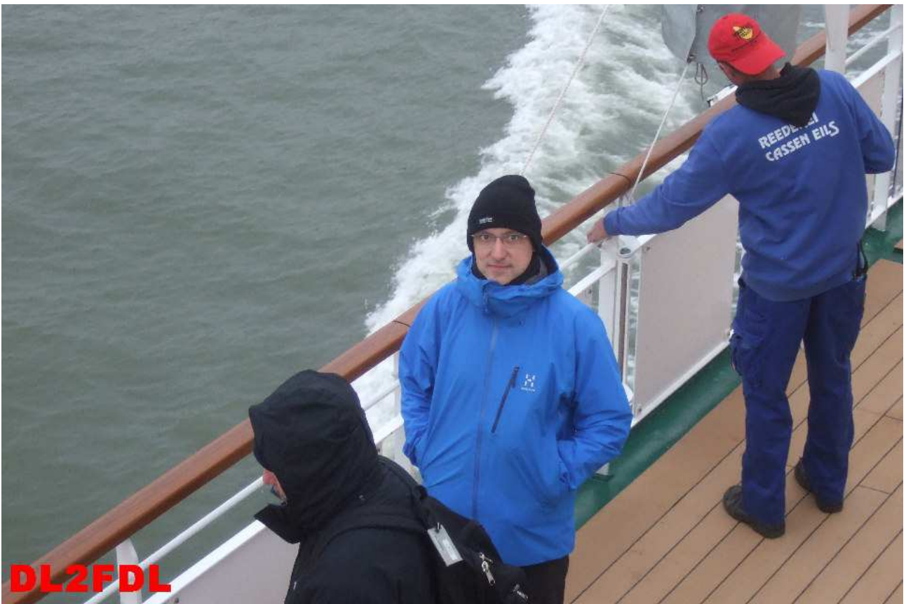
Ein letzter Blick, bevor die Insel im Nebel verschwindet.