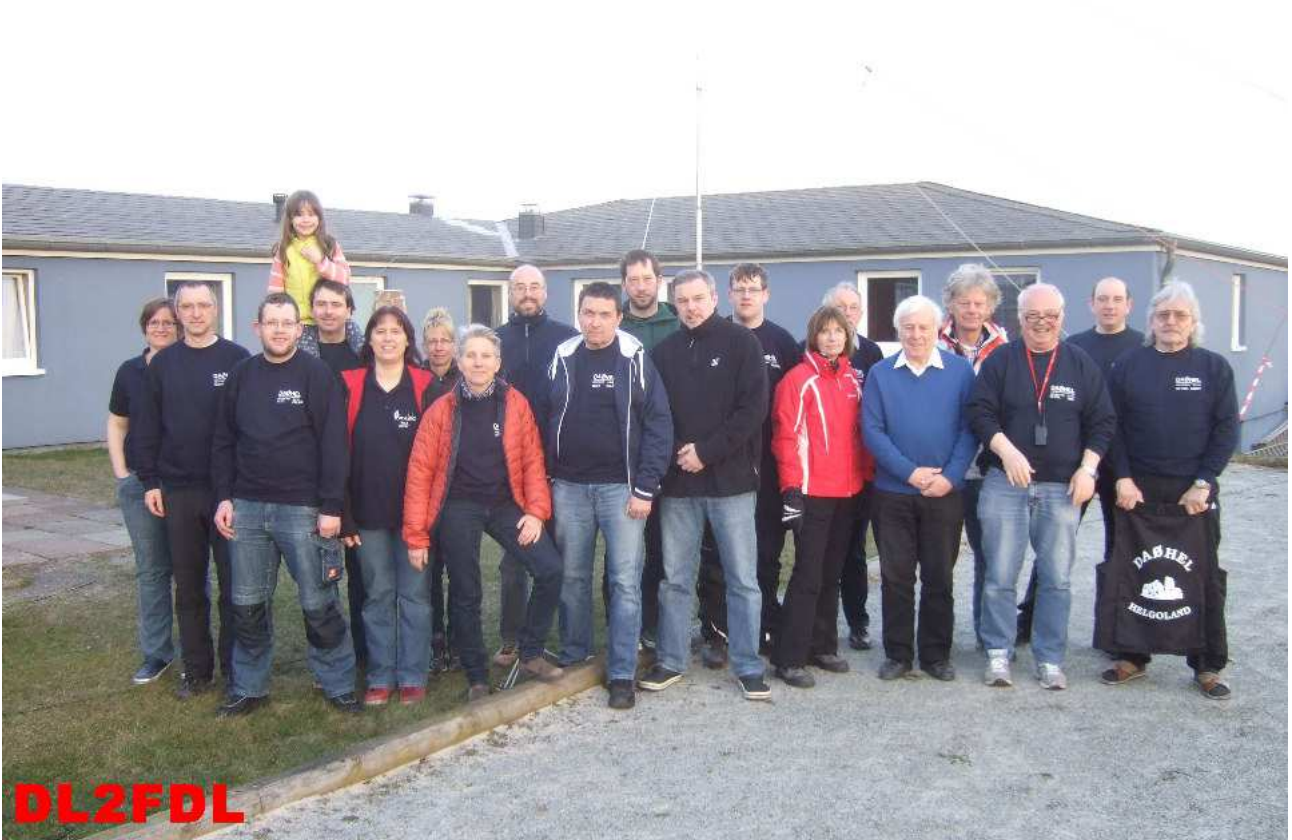
Dicht gedrängt .....