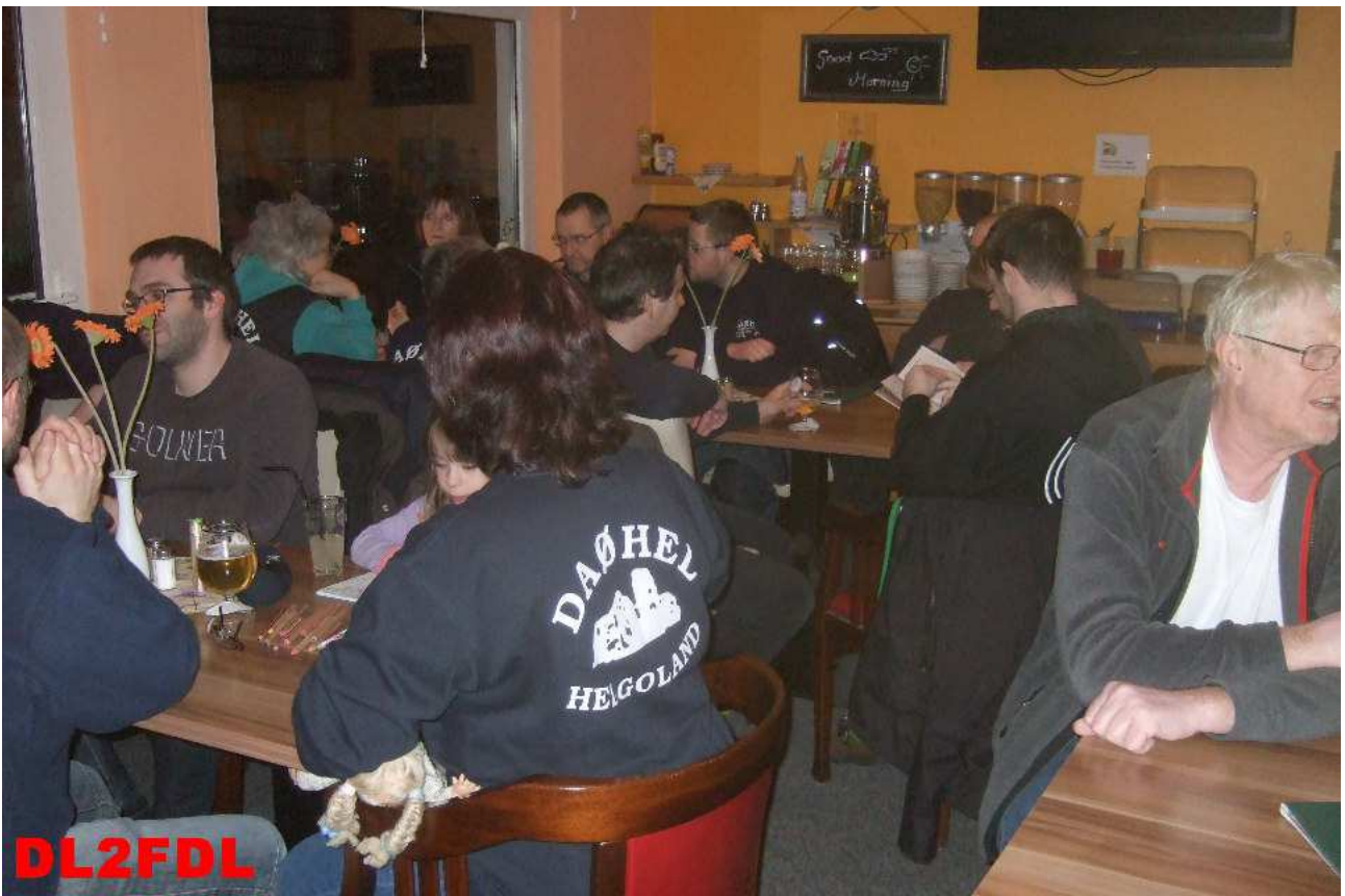
Ein gemeinsamer Abend bei einem Helgoländer Eiergrog oder Bier