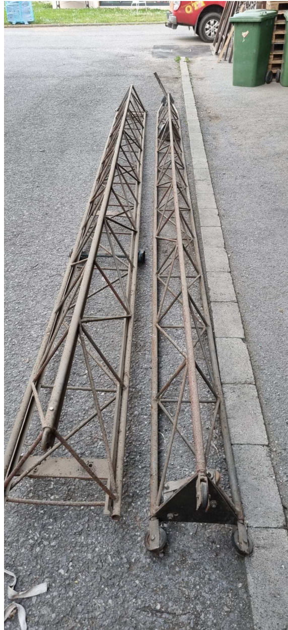
Beide Elemente, (Mitte links: Schwenklager für Kipheinrichtung)