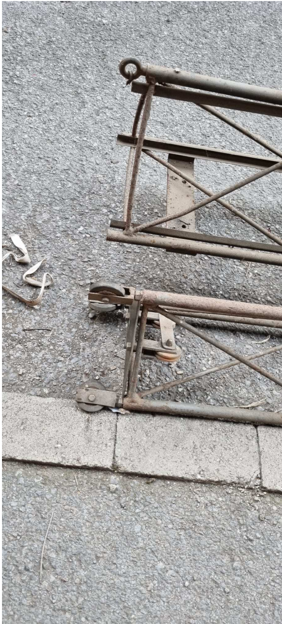
Führung des Innenelements, über Rollen und Führungsschienen, im äußeren Element