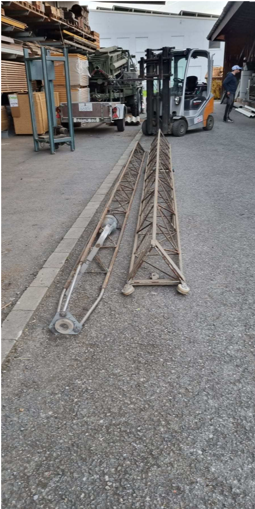
Mast mit Oberlager und Rotor. Hinten links: Mastfuß mit Winden und Elektroinstallation.

Für Kontakt: dl1cw@hotmail.com oder dl1sbf@t-online.de