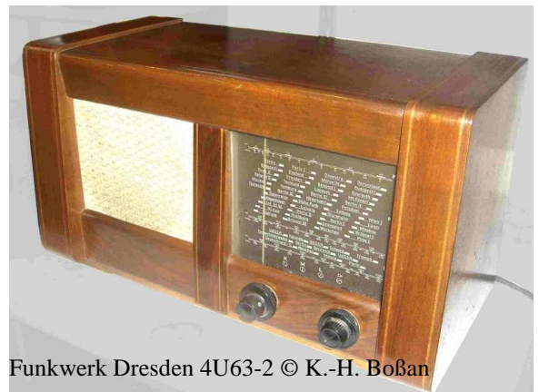
Funkwerk Dresden 4U63-2

Bitte auch hier: Teilnehmer mögen sich vorher bei mir melden.