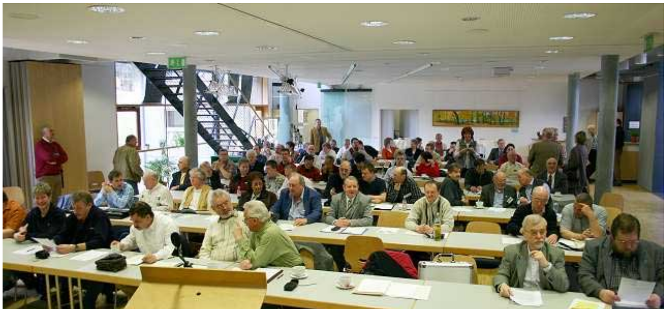
Gemütliche Atmosphäre im Tagungsraum des Hunsrückhauses am Erbeskopf