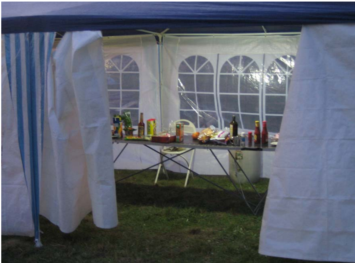
Wer feste arbeitet, darf auch Feste feiern...