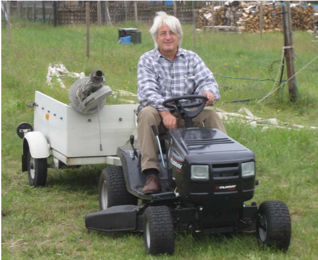
„Was macht Salvatore den ganzen Tag?“ – „TRECKER FAHR'N!!“

Nun begann der Aufbau der Vertikalantenne. Auch hier war wieder hervorragendes Teamwork zu beobachten: