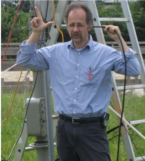
Yankee Golf: „SWR 1:2 !!“