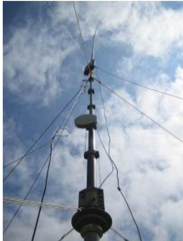
10 m Vertikalstrahler, 6 m Mast

Nach der aufwändigen Arbeit des Mast-Auf- und Ausrichtens, bei der alle OM's tatkräftig mithelfen, wurde die Station im Zelt installiert.