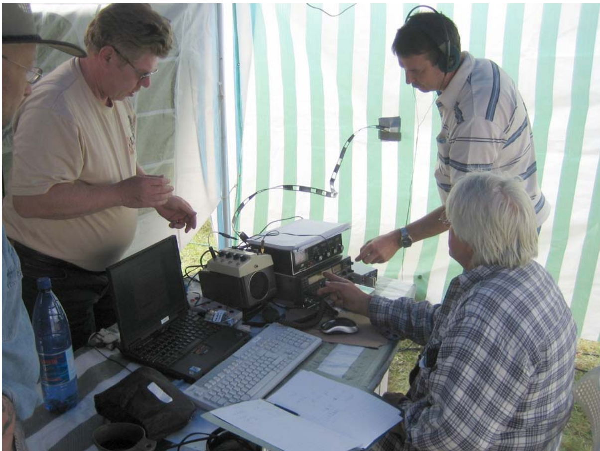
Man beachte die HF-optimierte Hühnerleiter-Durchführung, abseits der Zeltstangen.

Nach der aufwändigen Arbeit des Mast-Auf- und Ausrichtens, bei der alle OM's tatkräftig mithelfen, wurde die Station im Zelt installiert.