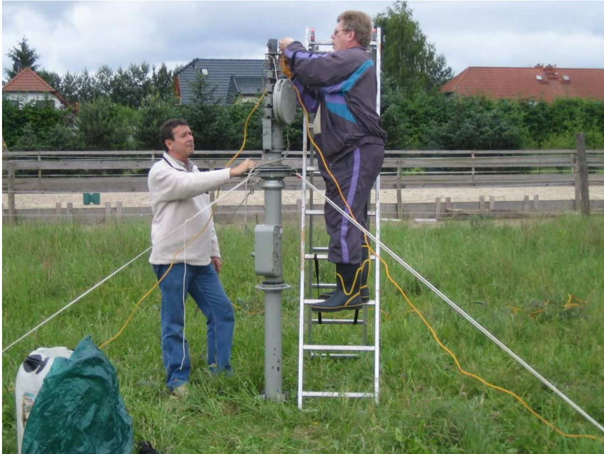
Deutsche Telekom, Funkstelle Bötzw.