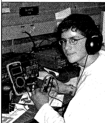
Amateurfunk macht Spaß

Möchten Sie per Funk mit Menschen in aller Welt sprechen? Das können Sie, wenn