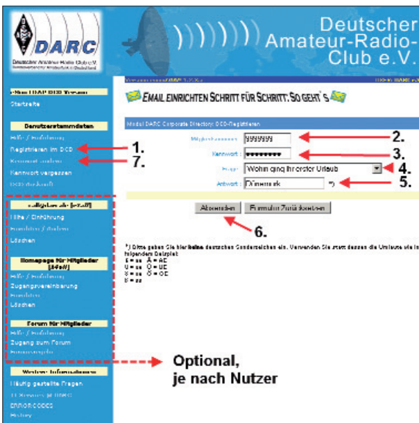
Bild 3: In wenigen Schritten zur Registrierung: 1. „Registrieren im DCD“ anklicken, 2. Mitgliedsnummer eintragen, 3. Geburtsdatum „rückwärts“ eintragen, 4./5. eine geheime Frage/Antwort-Kombination erstellen, 6. Absenden klicken, 7. im nächsten Schritt Kennwort ändern. Optional können Sie links unten weitere Serviceleistungen freischalten