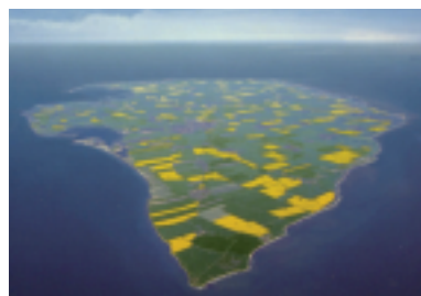
Insel Fehmarn (EU-128) aus der Luft betrachtet

sche Insel und führt die nationale Wertung weiter mit 55,6 % an. Es folgt EU-047 mit 52,5 %. Damit haben die Ostfriesischen Inseln deutlich zugelegt. Den größten Sprung nach vorn jedoch verzeichnet EU-129 (Usedom). Regelmäßige Aktivitäten zum IOTA-Contest und zahlreiche Urlaubsfunker dürften der Grund dafür sein. Die östlichste deutsche IOTA kommt nunmehr auf