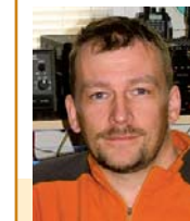
Beiträge für „DXtra“ an:

Vielen Dank für die DX-Informationen an DEØMST, DF5UG, DF8AA, DJ9ZB, DK7YY, DK9SC, DL1SBF, DL4BBJ, DL4KQ, DL7VOA, DO9WRL, F5NQL, F5NOD, GDXF, IOTW, MDXC, NG3K, OPDX, The Daily DX, V51AS, 425DXN und andere