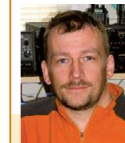
Beiträge für „DXtra“ an:

Vielen Dank für die DX-Informationen an DE3RPC, DEØMST, DDØVR, DJ9ZB, DK7YY, DL1SBF, DL4BBJ, DL4NBE, DL7VOA, DL7VOG, F5NQL, GDXF, IOTW, MDXC, NG3K, OPDX, The Daily DX, 425DXN und andere