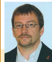
Beiträge für „DXtra“ an:

Für die DXCC-Challenge gelten natürlich alle DXCC exklusive der gestrichenen Gebiete.