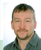
Beiträge für „DXtra“ an:

Vielen Dank für die DX-Informationen an DJ5AN, DJ9XB, DL1SBF, DL4BBJ, DX World of HAMRADIO, F5NQL, G3KMA, GDXF, NG3K, OPDX, RSGB-IOTA, The Daily DX, 425DXN und andere.