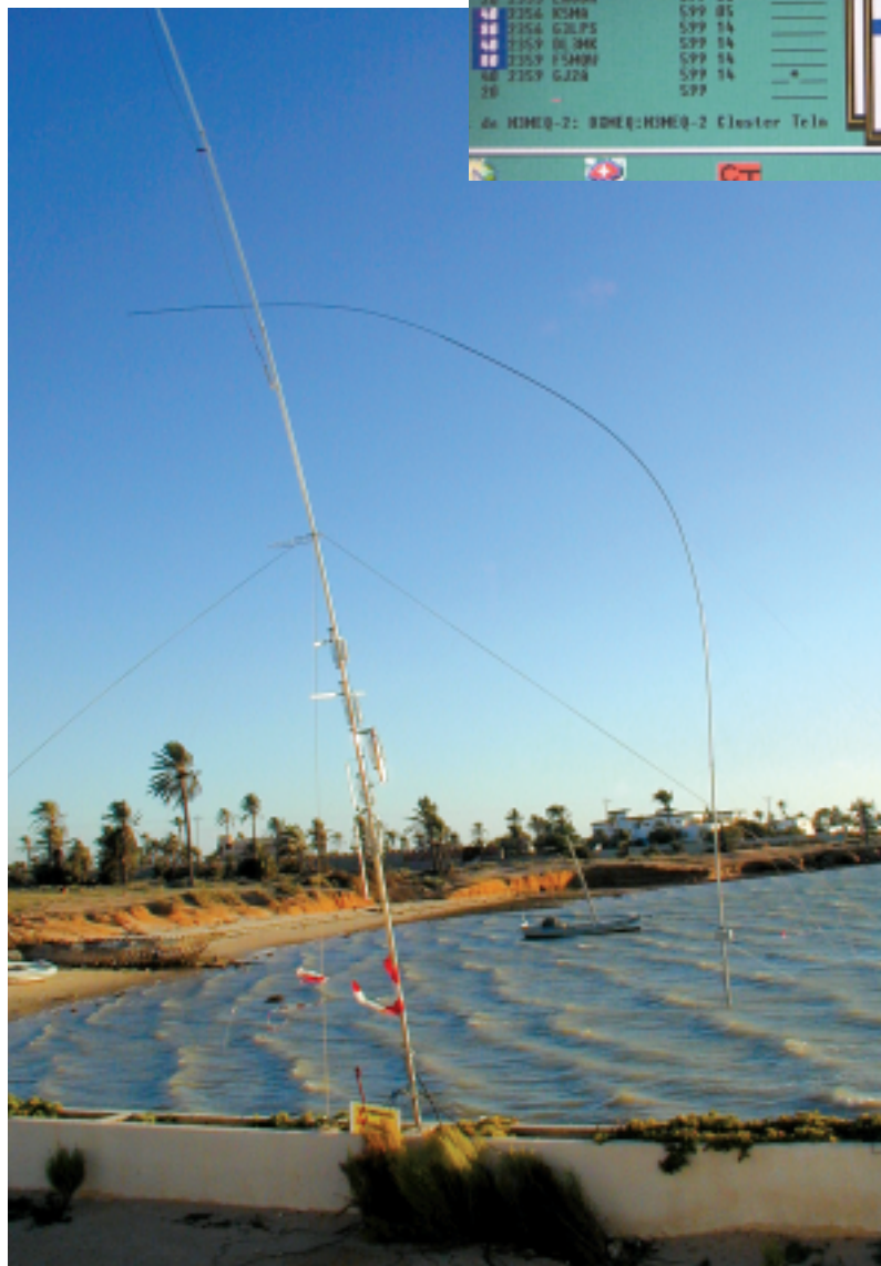
Die Butternut HF9V und V160E bei Windstärke 8