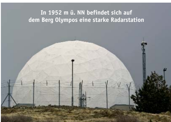
In 1952 m ü. NN befindet sich auf dem Berg Olympos eine starke Radarstation