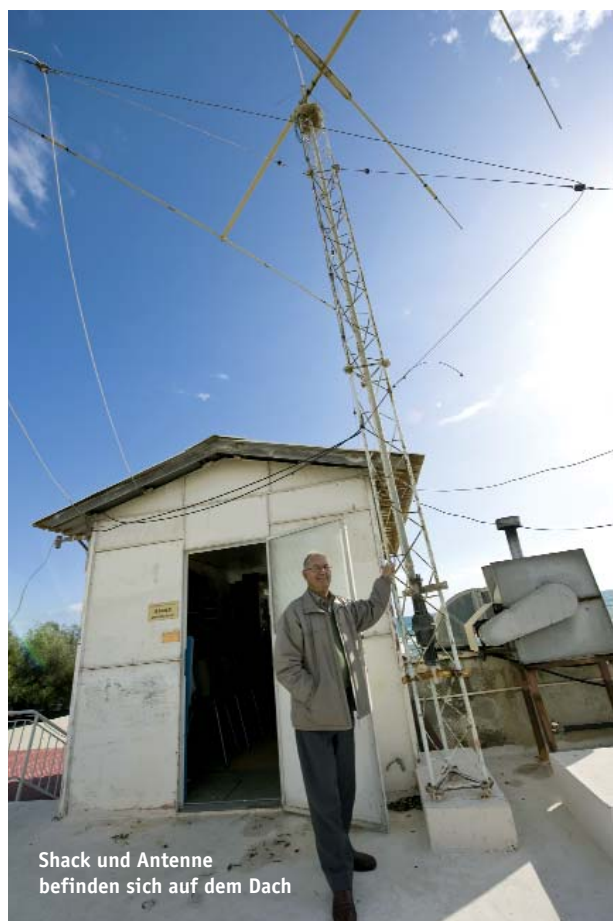
Shack und Antenne befinden sich auf dem Dach

Im östlichen Mittelmeer liegt Zypern. Ein vielfältiges Eiland, auch im Sinne der verwendeten Präfixe. SMØJHF war zu Besuch und begab sich auf die Spuren des Amateurfunks.