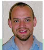
Beiträge für „Pile-Up“ an:

(Aus dem Englischen übertragen von Stefan Hüpper, DH5FFL)