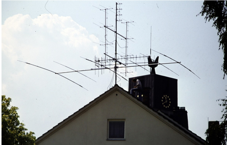
Kaulbachstr. Bayreuth 1977

Damit ~ 300 Länder auf Kurzwelle Fast 30 Länder auf 2m