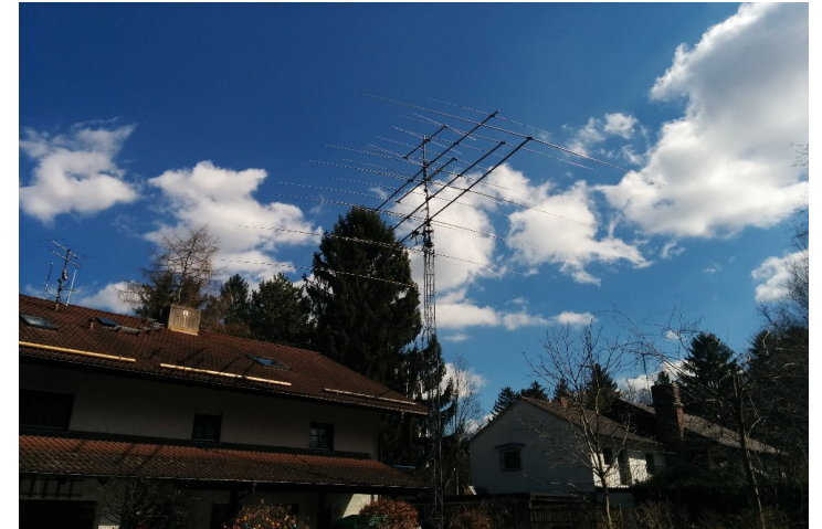
Ottobrunn ab 1990

Alle 340 Länder auf Kurzwelle in SSB und CW (außer P5) 292 Länder auf FT8 (QRV seit 5 Jahren) Pro Band 10m,12m,15m,17m,20m über 320 Länder 130 Länder auf 6m Fast 40 Länder auf 2m meist Sporadic E