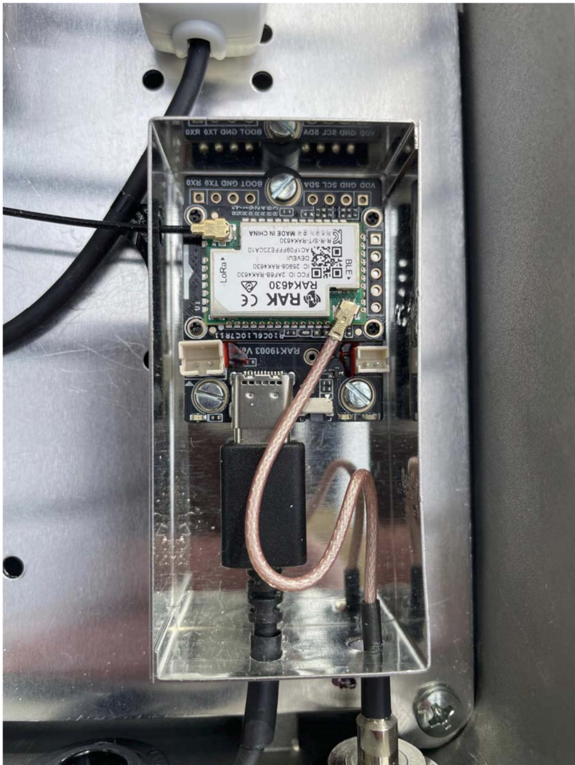
Bild 2: Detailansicht MeshCore-Modul RAK 4630 / 4631 im geöffneten Weißblechgehäuse