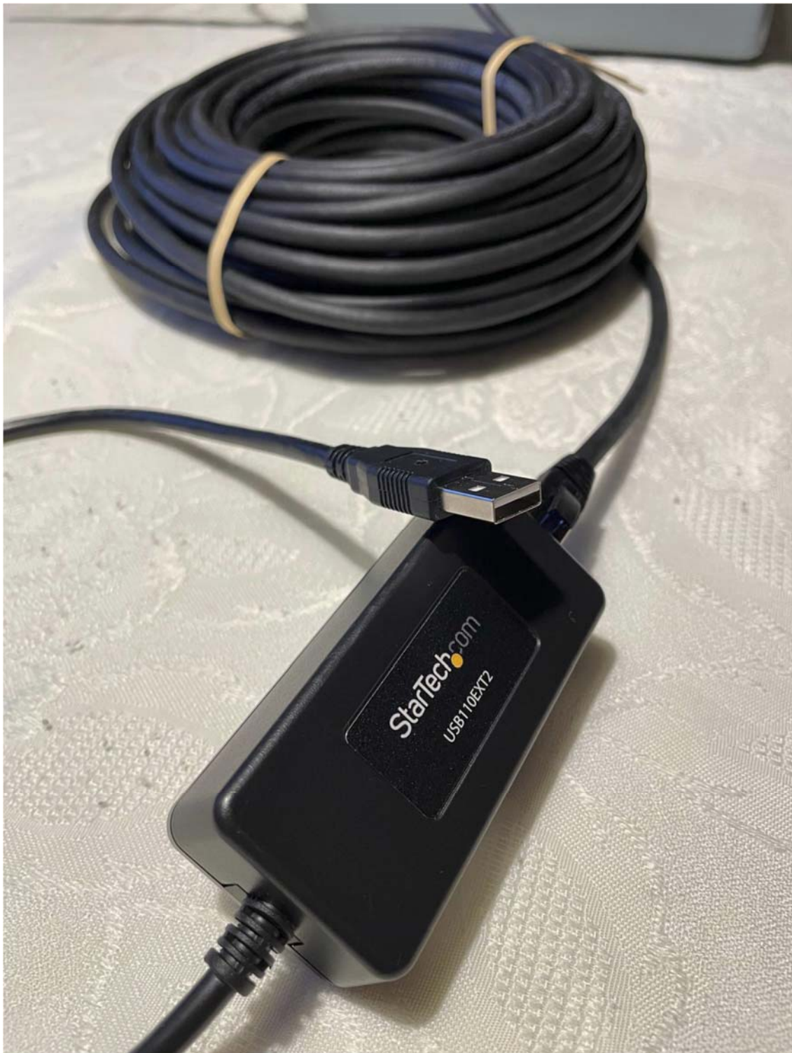
Bild 5: So sieht die andere Seite aus, Einspeisung der 5 Volt Betriebsspannung über den USB-Extender.