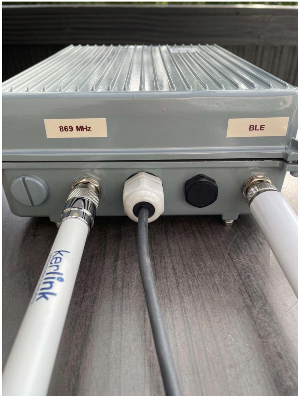
Bild 4: Ansicht des geschlossenen Gehäuses, Unterseite. Links wieder die Kerlink-LoRa-Antenne, in der Mitte das USB-Kabel (20m, Wetter- und UV-fest), danach der Entlüftungsstopfen und ganz rechts die 2,4 GHz-Antenne für Bluetooth (OTA).