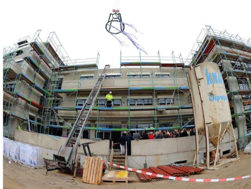
Mittwoch wurde Richtfest gefeiert. Die Fachhochschule des Mittelstandes will in Zukunft 500 Studenten in Frechen