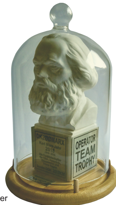
“OPERATOR TEAM TROPHY“ für Aktivierer