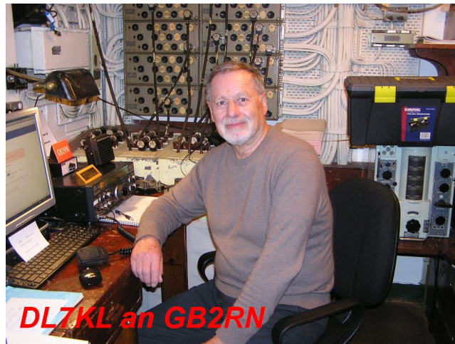
DL7KL an GB2RN

Näheres über die Londongroup der RNARS erfährt man hier: http://www.gb2rn.org.uk