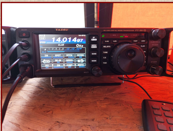
Der kompakte Transceiver YAESU FT991A

Bei dem gemeinsamen Treffen des Schleswiger Ortsverbandes geht es nicht in erster Linie darum, die Clubmeisterschaft zu gewinnen. Vielmehr stehen Gemeinschaftssinn, Teamgeist und das gemeinsame Erlebnis im Vordergrund. Das gelingt diesem Ortsverband auf besonders überzeugende Weise.