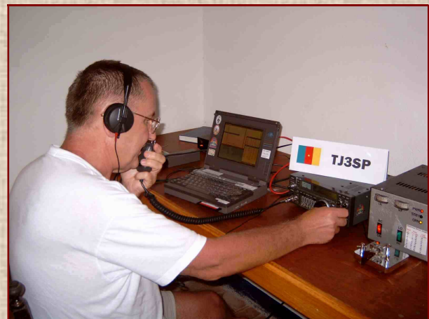
QRV unter TJ3SP