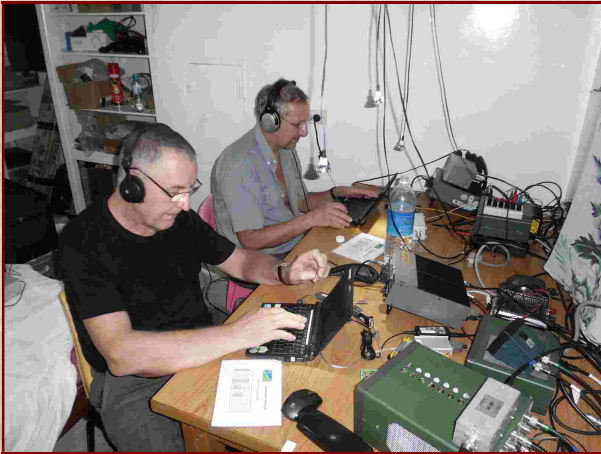
Auf Solomon Island als H44G