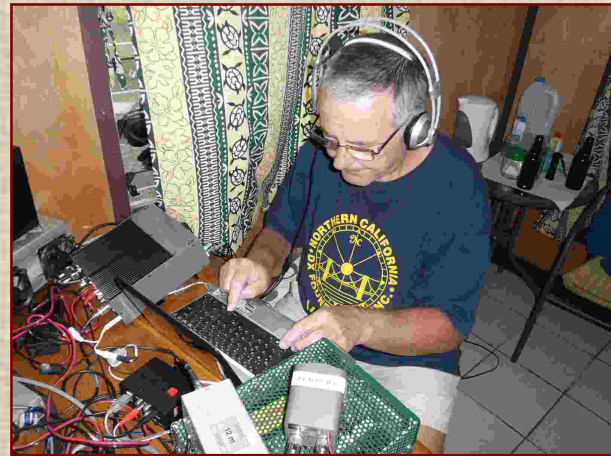
QRV als A35YZ