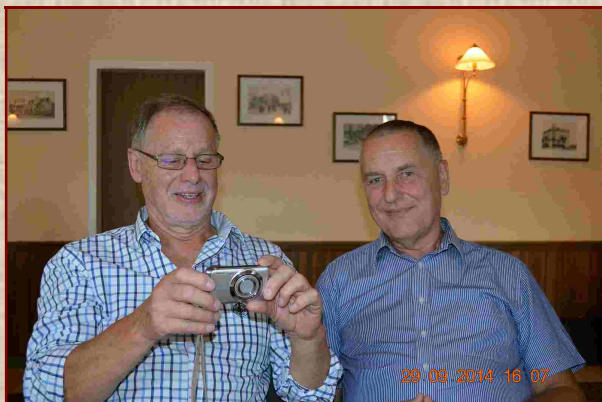
Berlin, DL7DFs 75ter Geburtstag