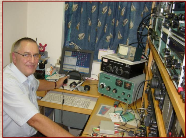
Im heimischen Shack in Polen