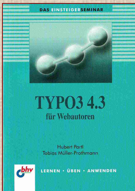
Mein kleines Lehrbuch

TYPO3 ist ein freies Content-Management-System für Webseiten, das seit Oktober 2012 offiziell unter dem Namen TYPO3 CMS angeboten wird. Der Kern von TYPO3 ist in der Skriptsprache PHP geschrieben, die Ausgabe im Browser erfolgt mit HTML und JavaScript. Neben Joomla, Drupal und WordPress gehört Typo3 zu den beliebtesten kostenfreien Content-Management-Systemen.