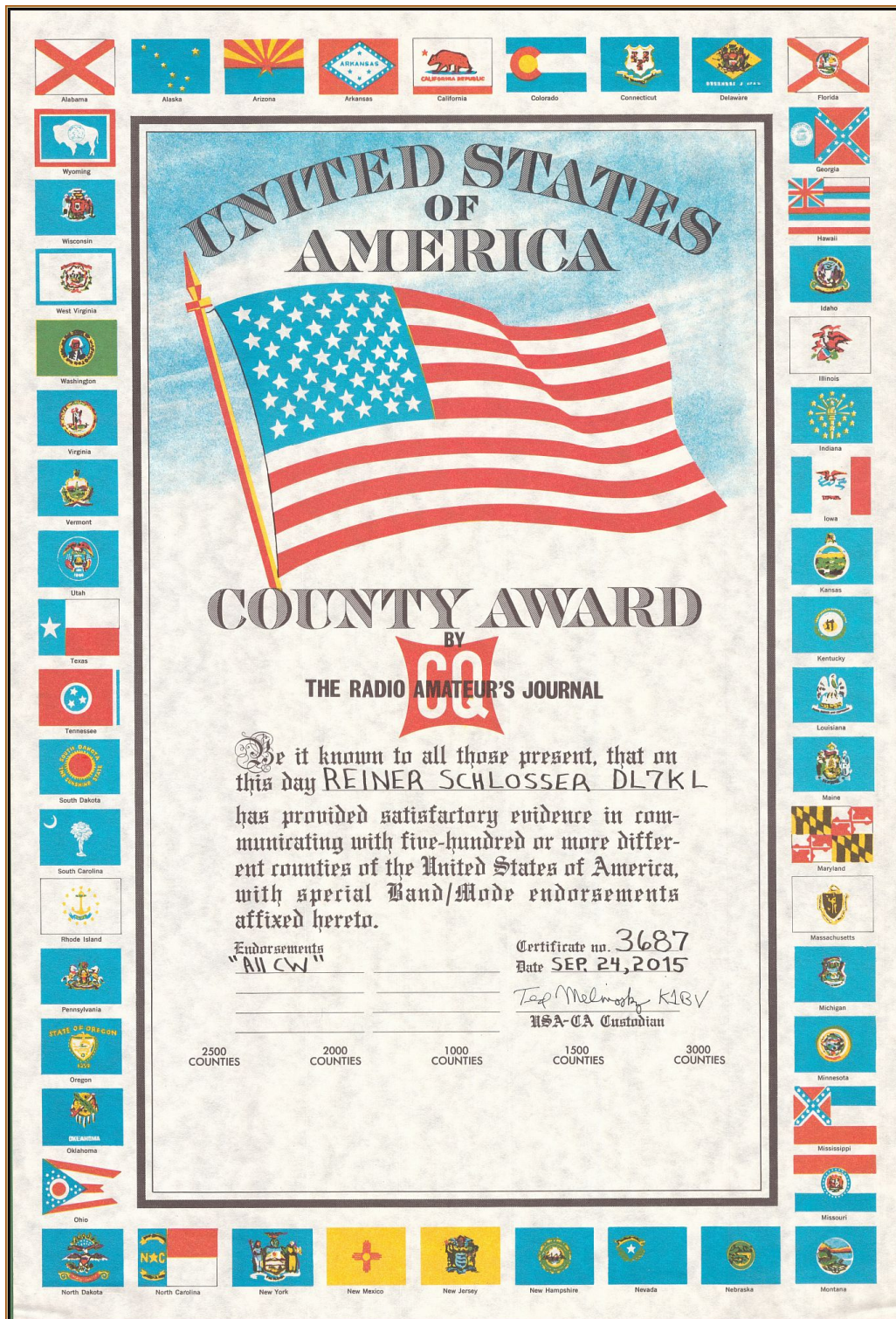
Bild1: Das USA-County-Award