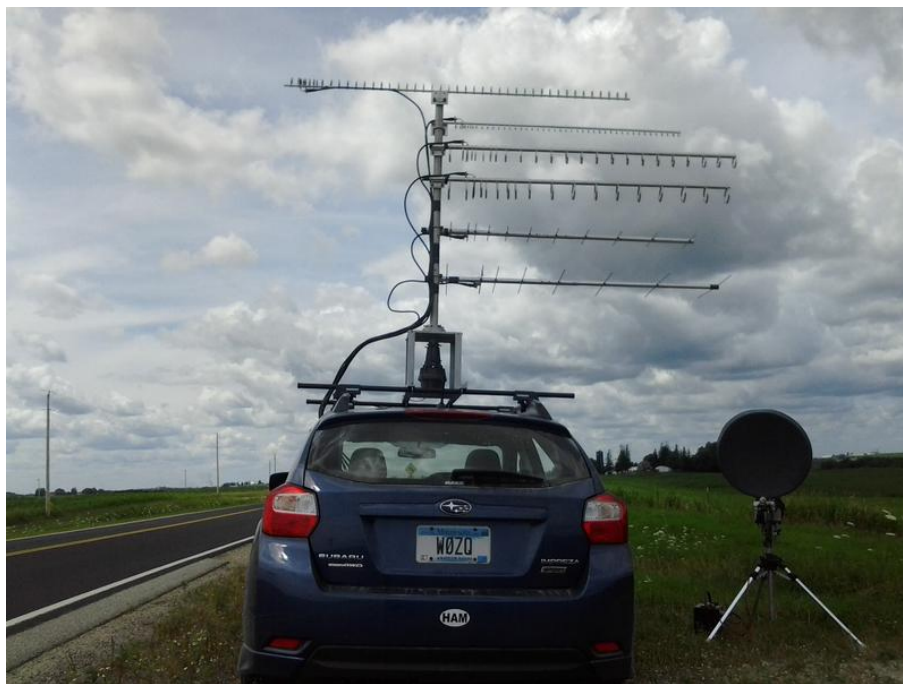
Bild 3, 4, 5: Kansas QSO-Party, QSL und Mobilstation von Jon, WØZQ [2]