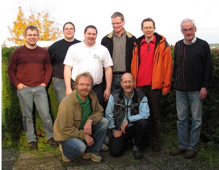
DD3QG DL7KEX DO4HAM DF6XE DM3SJ DJ8CR DF6QV DL9DAN

Gut, daß der Feiertag am Dienstag noch Gelegenheit bot, den fehlenden Schlaf nachzuholen.