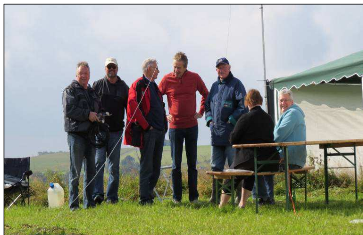
Bild 4 Plausch beim Fieldday in Kesbern

Vom 22. bis 24. August 2014 fand auf dem Fielddayplatz in Kesbern wieder der Familien-Fieldday statt. Trotz der wenig vielversprechenden Wetterprognose ging am Samstag (der immer der Hauptveranstaltungstag ist) nur ein kur-