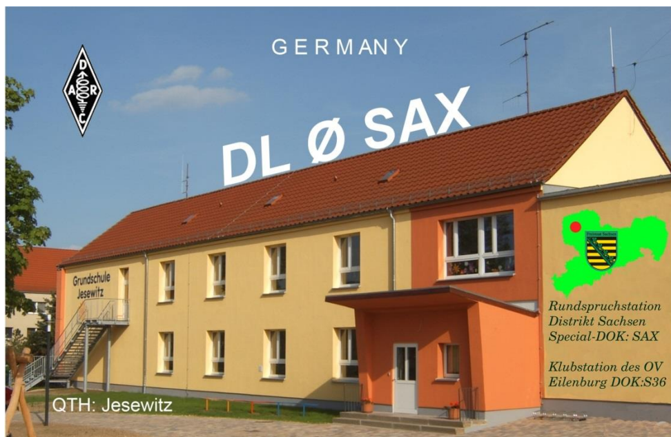
Rundspruchstation Distrikt Sachsen - QTH: Jesewitz (OV S36) - Schule Jesewitz -