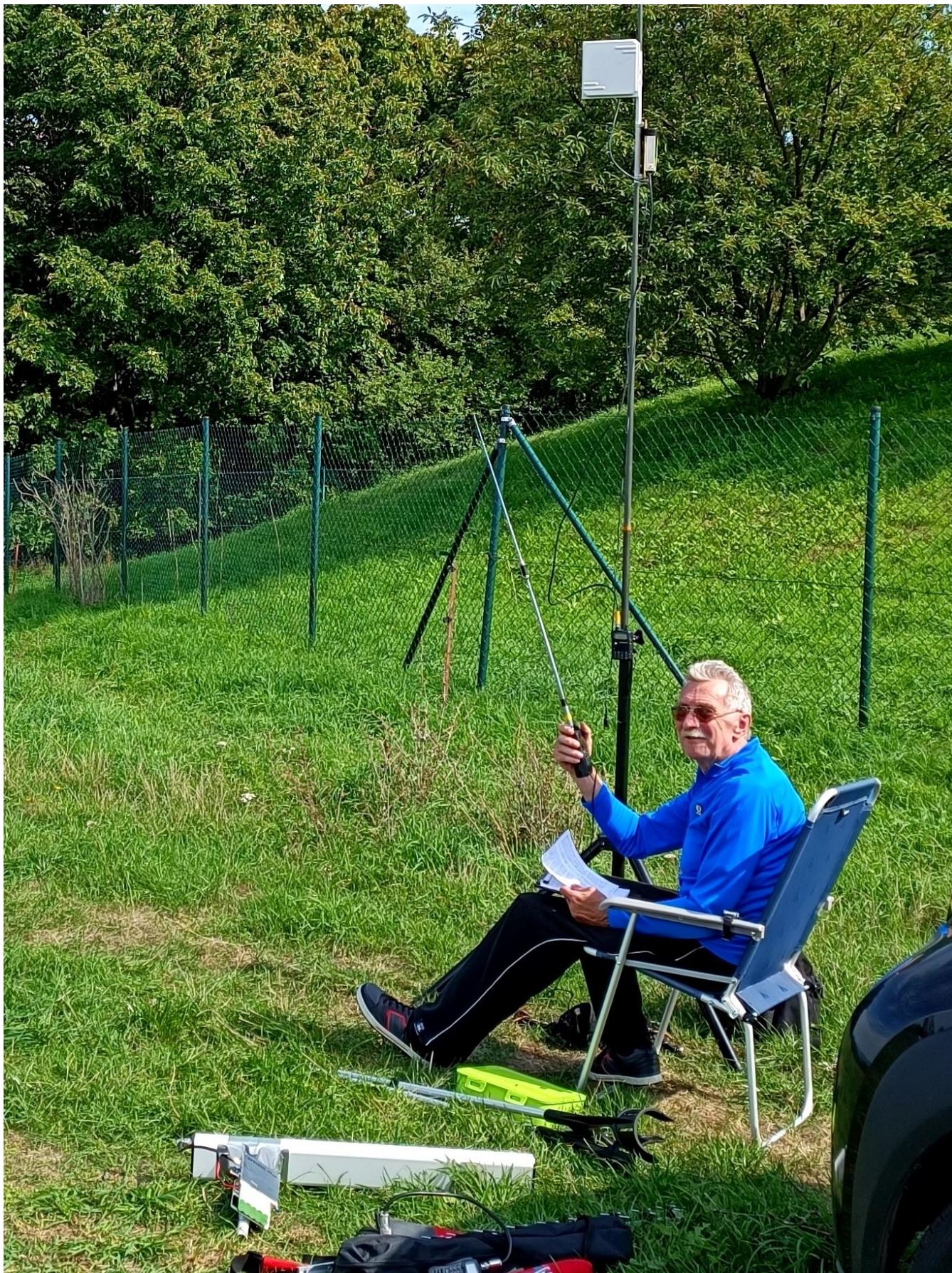
Gemütlicher Funktag auf dem Finckenfang