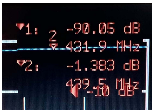
Abbildung 3: TX-Werte