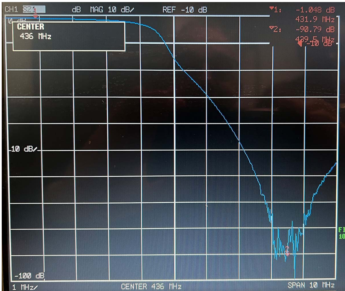
Abbildung 2: RX-Zweig, 431,8875 MHz nach Neuabgleich