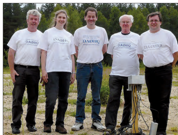
Das Dresdener Team funkte auf 80 m CW (DL1VDL, DL8DYL, DF2CK, DL1DTL, DL9DRA)