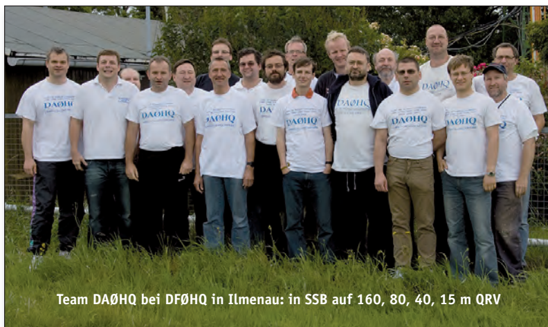
Team DAØHQ bei DFØHQ in Ilmenau: in SSB auf 160, 80, 40, 15 m QRV

Am Samstag des 2. Juliwochenendes, dieses Jahr also am 10.7.2010, pünktlich um 1200 UTC startet wieder die IARU-Kurzwellen-Weltmeisterschaft. Dazu möchten wir euch alle recht herzlich einladen.