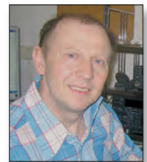
Gerd, DL1NGS, auch Op bei DLØKC hat es gleich zwei Mal in 6 Min. geschafft, alle 12 Punkte an DAØHQ zu vergeben