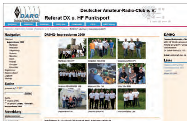
Neues Design der DAØHQ-Webseite