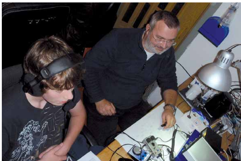
Ausbildungscontest beim OV Meiningen (X37)

Am 15. Oktober lud der DARC e.V. erstmalig zu einem Ausbildungscontest ein. Zur Premiere mischten bereits so viele Stationen mit, dass es im nächsten Jahr eine Fortsetzung geben wird.