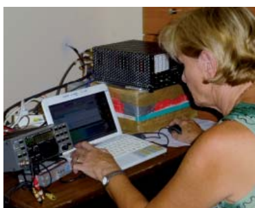
Station mit K2, Laptop und „homemade“-PA

Wir sind über das Internet mit dem Cluster verbunden. Ab und zu fällt der Provider aus. Schlimmer sind gelegentliche Stromausfälle, die dann mehrere Stunden lang dauern. Wir haben eine Autobatterie zur Notversorgung ohne PA-Betrieb – natürlich geht das nur für kurze Zeit. Wir haben fast alle Tage