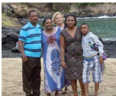
Unsere Gastgeber am Strand von Tarafal. Im Hintergrund Babs, DL7AF5

bei 70 kg Gepäck. Für persönliche Sachen und Kleidung bleibt wenig Platz.