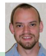
Beiträge für „Pile-Up“ an: